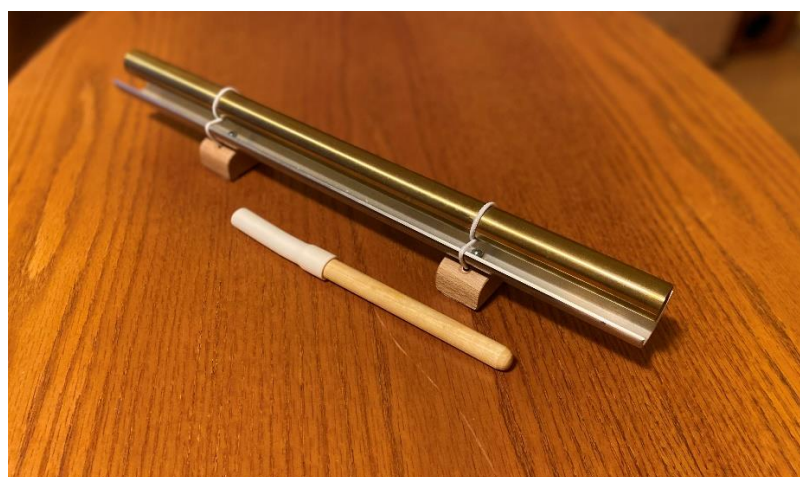
Obr. č. 4: Vibrafon 528 Hz